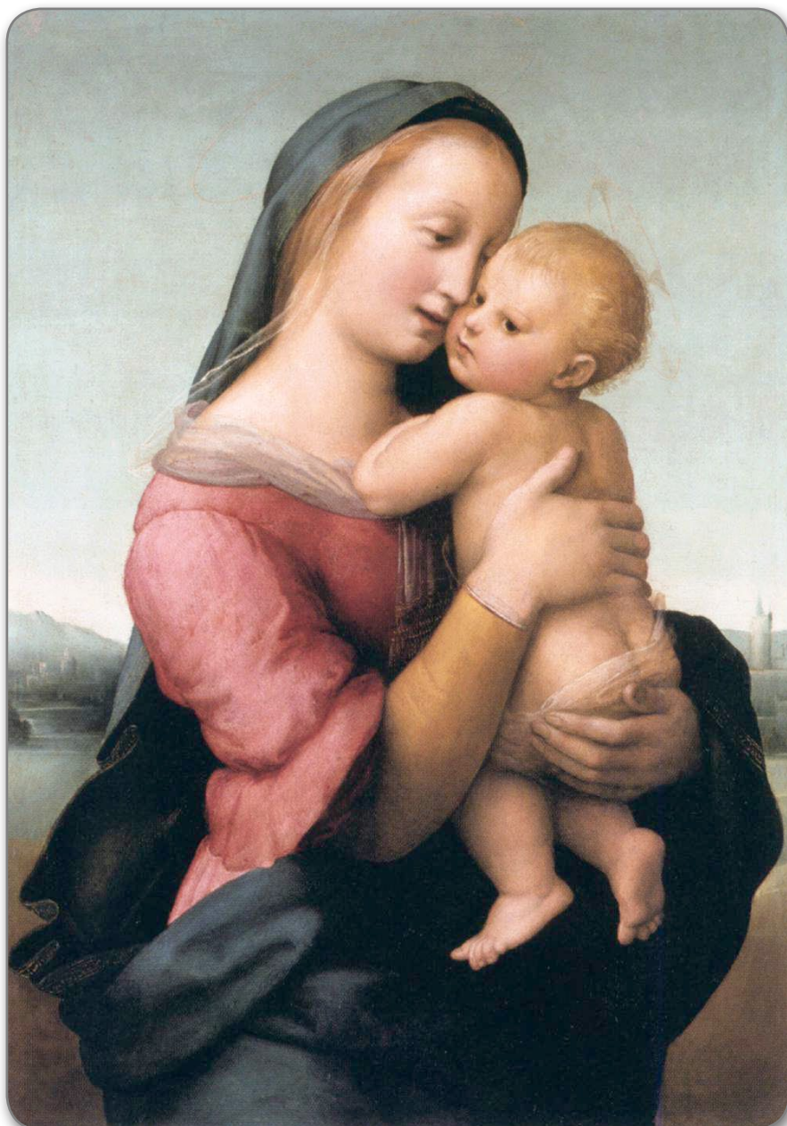
Рафаел - Мадона с Младенец (Tempi Madonna) 1508 г., Масло върху дърво, 75 x 51 см.