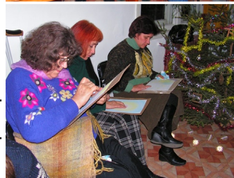
Фоторепортаж от коледното тържество в Стара Загора 16.12.2006 г.