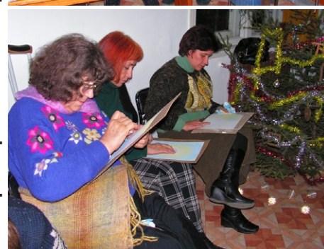
Фоторепортаж от коледното тържество в Стара Загора 16.12.2006 г.