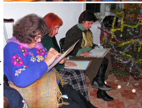
Фоторепортаж от коледното тържество в Стара Загора 16.12.2006 г.