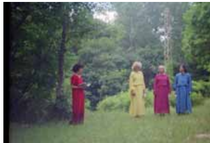
Йоановия празник край Стара Загора, 2008 г.