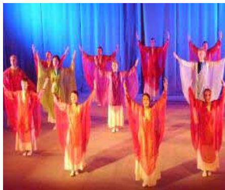
Евритмичния ансамбъл на Ирландия

Евритмичните ансамбли на Щугард, Германия и на Гьотеанума скоро се утвърждават като част от културния живот в Европа. Ансамбълът на Гьотеанума печели златен медал на Парижкото изложение през 1937 г. Днес в много страни има центрове за обучение и художествени ансамбли.