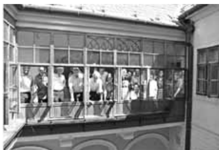
Домът на Шрьоер. Поглед във вътрешния двор