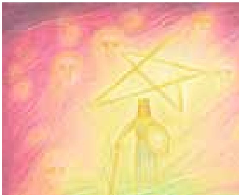
„Михаилова имагинация“ Герхард Райш