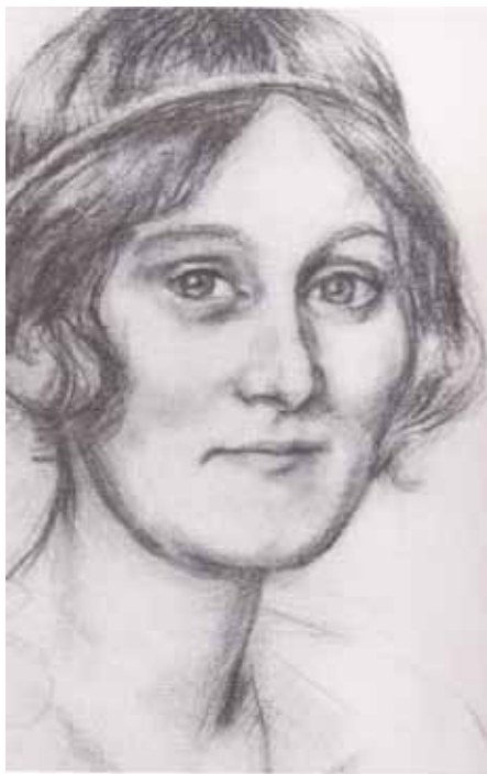
Портрет с червен пастел от Клаус вон дер Декин

След първата лекция на 15 септември 1912 г. от цикъла върху Евангелието на Марко, която в известен смисъл е пътепоказател към новото изкуство на движението, Лори и майка ѝ са поканени от Рудолф Щайнер да го посетят на следващия ден в къщата в Ботминген близо до Базел, където бил отседнал. Той ги посрещнал в малка стая на приземния етаж. В нея имало само един диван, една маса и няколко стола.