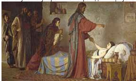
В. Поленов – Христос възкресява дъщерята на Яир

Мога да дам един пример за мои лични изживявания при реализиране на идеал. Преди много години работих като лекар в Коми, тогава Автономна република към СССР. Отговарях за здравето, а понякога и живота на над 6000 работници, дървесекачи при дърводобива в тайгата на Далечния север. Налагаше се на място да оказвам понякога животоспасяваща помощ на пострадалите до закарването им в българската болница в селище Усогорск, отстоящо на 45 км. от нашето селище – Благоево. Моят идеал беше с всички възможни средства, с оскъдната и остаряла медицинска техника, да не допускам смъртни случаи . Така на място, понякога само с лекарства и медицински инструменти, съдържащи се в куфарчето за спешна помощ и благодарение на моята осъзната и дълбоко проникнала в душата ми мисъл - “Не Аз, Христос в мен” , можах да спася шест млади хора вече в клинична смърт, или близо до нея. В такъв момент се чувствах сякаш съвсем сама в целия свят с умиращия човек и се обръщах с всичката сила на душата си към Христос за помощ. И изведнъж се успокоявах, преставах да треперя от страх дали ще успея. В този миг почувствах прилив на сили, спокойствие, бързо изплуваха всичките необходими медицински познания какво трябва да направя. Извършвах го и човекът се връщаше към живот. Велико нещо е, щастие е да почувстваш силата на Христос!