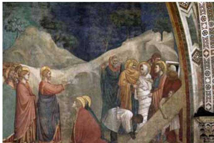
Джотто - Възкресението на Лазар