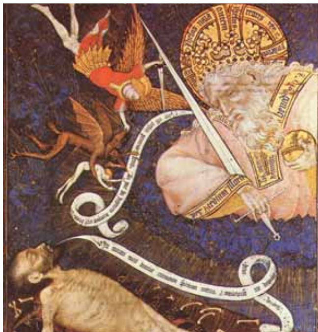
Фиг. 2↑ и 3↓

Въпросната власт враждебните на Бог духове упражняват на земята, а не на небето, откъдето са свалени по време на Битката на небето през 50-те години на 19 век. Така се стига до появата на определен вид зло в земния свят, което най-вероятно има общо с въпросната англо-американската окултна групировка. То обаче, както става ясно, не се налага на земята по своя собствена воля, а по божествена! С всичко това има общо архангел Михаил, който неслучайно е наречен „Кой е като Бога?” и „Лицето на Яхве”. На безбройните апокалиптични сцени от старите майстори, които отразяват Битката на небето, той стои редом до Яхве (фиг. 2 и 3) и дори си взаимодейства с него, какъвто е случаят на фиг. 2. От това става ясна дълбоката връзка между двамата, която датира от древността и продължава до ден днешен.