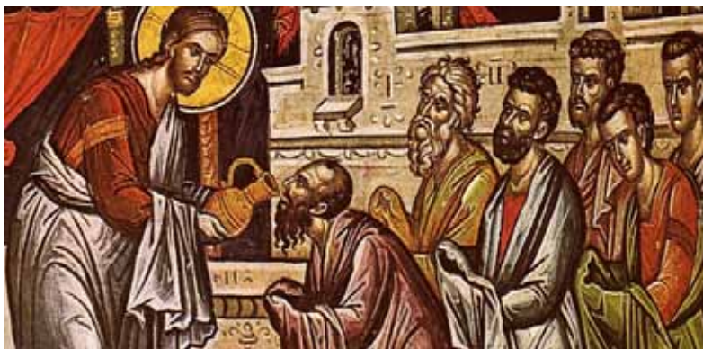
Измиването на нозете - стенопис

Седем са стъпките на Христос от земното битие към човешкото безсмъртие. През седем степени преминава Неговата божествено-човешка същност - от „измиването на нозете“, през „трънния венец“, „бичуването“ и смъртта, за да стигне до Възкресението и Възнесението. Това е спасителният път на човешките души, решени да следват Христос. Днес сме едва в началото. Осъзнаването на собствените житейски задачи, преодоляването на слабостите