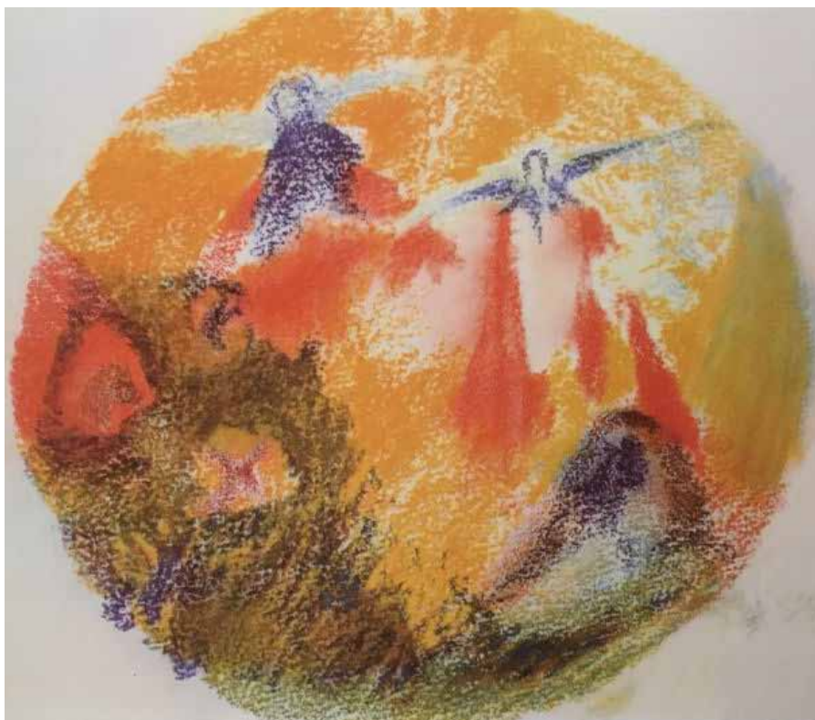
Атлантида – Рудолф Щайнер, 1914 г.

„Земята е сцената на човека. В земното съществуване той живее в своята душа и събира в своя Дух силите на звездното небе. Покълвайки с кълновете, цъфтейки с цветовете, давайки плод с плодовете, тъкмо в разгара на лятото човекът се подготвя за едно пълно отдаване на живота си във Вселената. И тогава всяка светулка се превръща в тайнствено откровение за Космоса, всеки полъх в атмосферата – в едно космическо възвествяване, което отеква в земния свят”