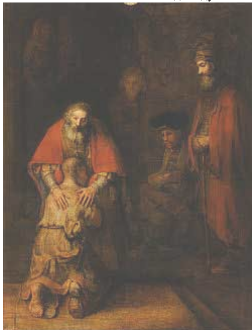
Рембранд - „Завръщането на блудния син“