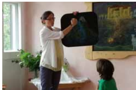
Открит урок за първи клас в детска школа „Изида“