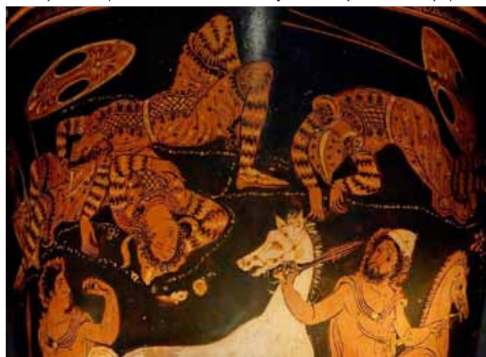
Фиг. 2. Отвличането на тракийските коне, детайл от сцена върху древногръцка ваза

Най-вероятно именно заради специфичното им изоставане от другите народи, в десета песен на „Илиада“ Омир казва за траките, че „стануват последни от всички“ във военния лагер на съюзническите войски на троянците. На тях единствено е отделена цяла глава, която е ключова, а описанието им има приказен, трудно разбираем характер. Особено забележителна е тяхната съдба да бъдат избити още в нощта на пристигането, и то само от двама противници – гърците Одисей и Диомед. (Фиг. 2) Истинската цел на последните е отвличането на тракийските снежнобели коне, което обръща хода на войната, която, както е известно, се явява преход между Третата (египетско-халдейска) и Четвъртата (гръцко-латинска) културна епоха. Ключът за това е в тракийските коне, които са образ на интелектуалните сили на зараждащата се Разсъдъчна душа на древните гърци.