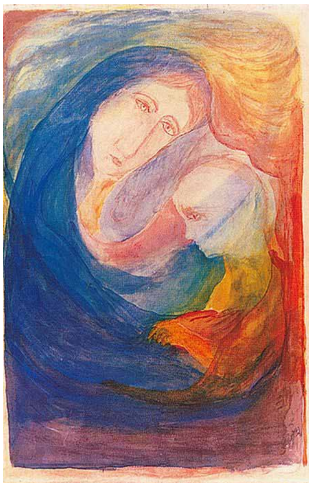
Рудолф Щайнер – „Майка и дете” – акварел, 1924

Човекът върви към бъдеще, когато духовната светлина ще проблисне от вътрешността му и ще заблести в целия свят. Това трябва да прозвучи в душите ни по времето на Коледния празник. Тогава ще можем да празнуваме Рождеството като празник в името на най-висшия идеал на човечеството, а Свещената нощ ще породи в душата ни радостната сигурност: „Да, и аз ще изживея в себе си това, което трябва да се нарече раждането на висшия човек и в мен ще се извърши раждането на Спасителя, раждането на Христос.”