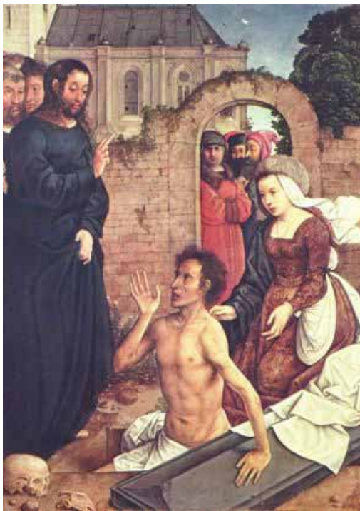
Хуан де Фландес, Възкресението на Лазар (около 1500 г.) Музей Прадо, Мадрид

Чрез своите изследвания Рудолф Щайнер не само осветлява въпроса за личността на автора на евангелието на Йоан, но и разширява кръгозора ни, разкривайки истини относно историческото присъствие и духовни процеси, свър-