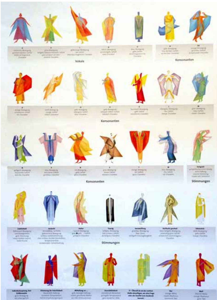
Евритмични жестове, съответстващи на отделните звуци

Това всеобхващащо духовно сътворение може да бъде опознато само