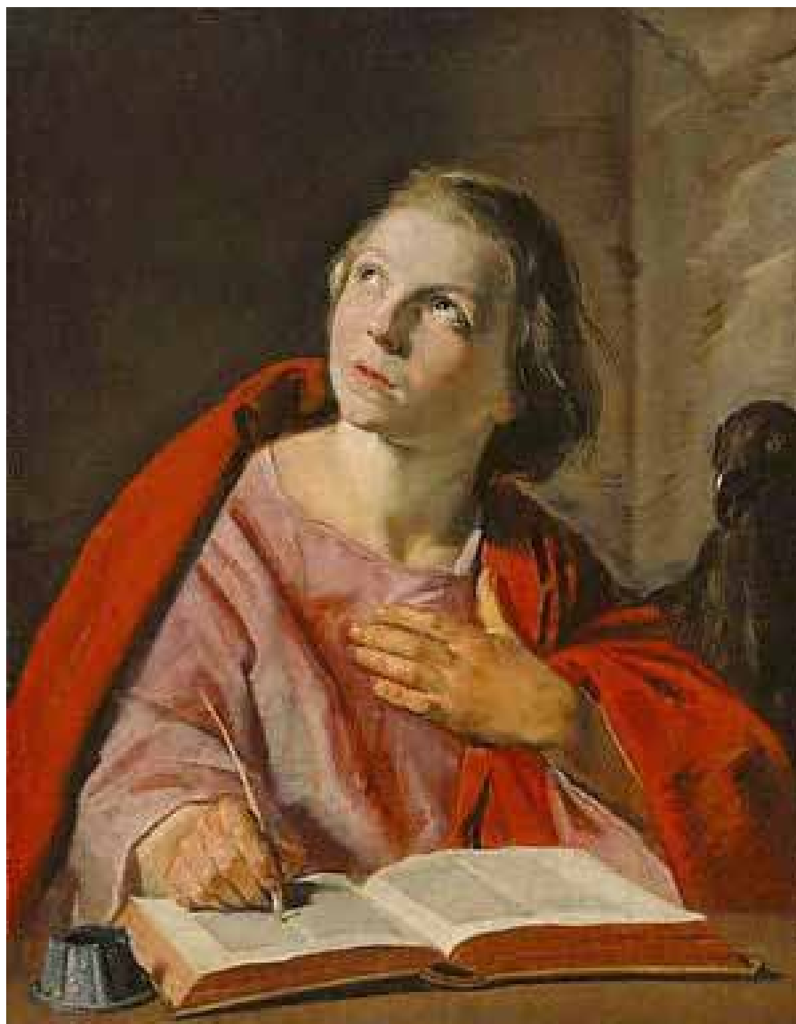
Евангелистът Йоан – Франс Халс (1625 г.)

„Този е ученикът, който свидетелства за тия неща и който ги написа и знаем, че свидетелството му е истинно.“ (Йоан, гл. 21, 24)