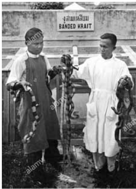
Сиам - Тайланд, Банкок, порода отровни змии за извличане и изследване на ваксината - противоотрова, особено на ваксината против бяс - Институт на кралица Саовабха, 1920-30 г.

Пример за това, което искам да кажа откриваме, когато погледнем към хора, които не са част от настоящите цивилизовани народи, индусите. Индуски лекари използват принцип, който е в основата на имунизацията, ваксината, която познаваме като лечебен серум. Това е борбата с някаква форма на заболяване, като се използва самия патоген като средство за защита. Хиндуистките лекари лекуват ухапвания от змии, като третираат раната със слюнката си. Чрез специално обучение, слюнката им се подготвя, тъй като те са направили имунизация срещу ухапвания от змии, срещу змийска отрова, върху собственото си тяло. Тяхното мнение е, че лекарят също може да помага и чрез това, което развива в себе си. Всички лечебни ефекти от човек на човек се базират на този принцип. При индусите този принцип се основава на определено посвещение. Вие знаете, че човек става различен чрез определено обучение. Силите, които човек не притежава могат да се развиват в него точно както желязото развива своята сила чрез намагнетизиране. ( GA 053, стр.470)