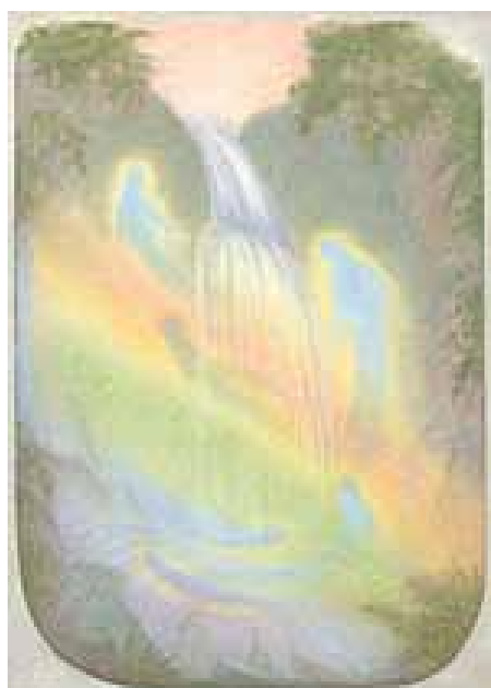
„Ундини над водопад” – Г. Райш

Водния: Това е денят, в който се ражда второто Исусово дете, чиято история е разказана в Евангелието на Матей, но вие знаете това! Въпреки че за съжаление повечето човеци вече не го знаят. Това Исусово дете е бъдещият Исус.