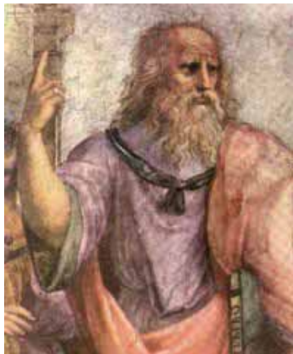
Древногръцкия мислител Платон (427-347 г. пр. Хр.)

В дните на прехода от празника на Архангел Михаил към Рождество Христово в човешката душа оживяват отново четирите основни добродетели, познати на човечеството от древността: СПРАВЕДЛИВОСТ, УМЕРЕНОСТ, ХРАБРОСТ и МЪДРОСТ.