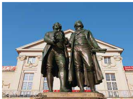
Паметника на Гьоте и Шилер във Ваймар

Докато в древността хората със старото ясновидство са усещали жива връзка с духовния свят и са знаели, че чрез начина на мислене и чувстване художественото е било втъкано в цивилизацията, че тя не би могла да съществува без него, то сега се шири мнението, че изкуството не е необходимо, а е почти лукс в живота ни. Всъщност това чувство, че изкуството е само за някаква определена категория хора, възниква през 19 век след времето, по което е живял Гьоте.