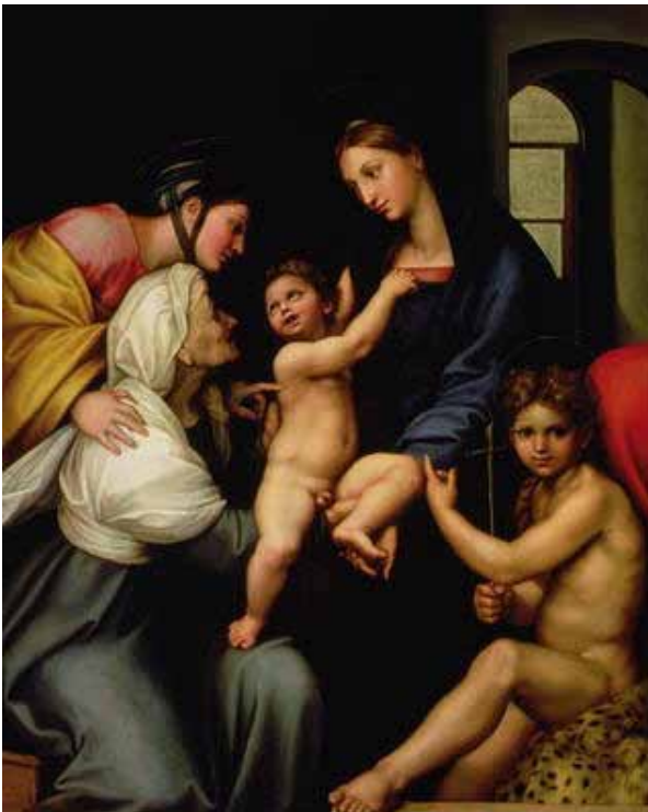
Мадона – Рафаело Санти

От всичко, което вижда и преживява там той успява да внесе хармония в това, което не може да направи в своето творчество, когато е на север във Ваймар. Тази среща на Гьоте с гръцката класика му дава възможност да разбере как древните елини са създавали своите художествени шедеври - те са се ръководели от природните закони. Според думите на Рудолф Щайнер: „Гьоте вярваше., че гръците получават един вид помощ от Боговете, така че тези художествени произведения се превръщат в нещо като по-висши природни произведения, а по този начин и в отпечатъци на божествено-духовния свят.” А онези, които станаха последователи на Гьоте разбираха, че за да бъде намерен отново пътят към Духа, трябва да се върнат в миналото до изкуството на Древна Елада.