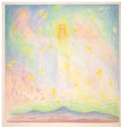
„Новата Изис” – Герхард Райш

Това е Антропос-София – голямата рождественска имагинация. От субстанцията на Божествената мъдрост, роденото от небесната София ново същество, на което се пада да приеме в себе си духовното слънце Христос.