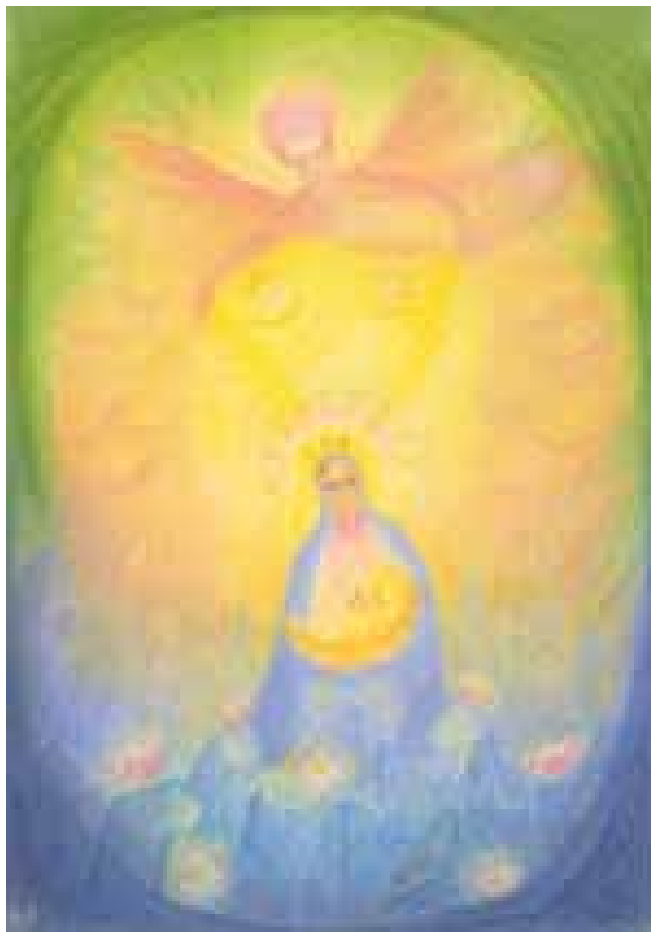
„Мадона“ – Герхард Райш

Да благодарим на духовния свят, Който поддържа живота ни на земята, Който ни озарява с вечна светлина, За да не угасне Пламъкът на аза.