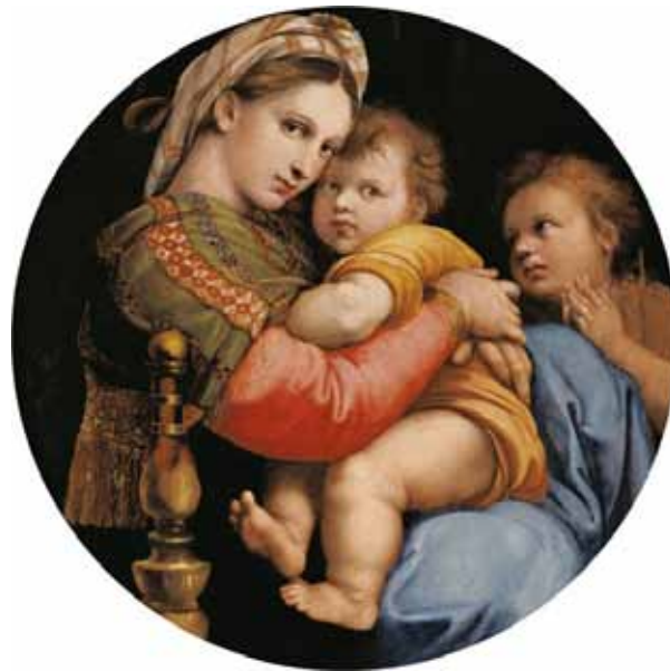
Мадона – Рафаело Санти

то следват духовните закони. Разтърсващо и удивително е въздействието на картините на художниците: Рафаело, Леонардо да Винчи, Микеланджело, Рембранд, Караваджо, Веласкес, Ел Греко и др. всепризнати майстори на светлината и сянката. Цветовете им наистина са дишащи и живи, защото, когато са творили, самият божествен свят е бил с тях. Застанем ли пред Сикстинската Мадона на Рафаело, ние затаяваме дъх, покланяме се, благодарим и благоговеем пред величието на майката даряваща на света Божия син!