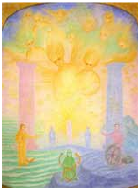
„Обърнатият култ“ – Г. Райш

Седем-степенното посвещение, което е първият път на човешката душа към Христос, съответства и на седемте основни Християнски празници, които от своя страна са седемте степени на посвещението на самата земя. А това посвещение тя е започна да преминава от Поврата на времената. Това е нейният път към превръщането ѝ в ново слънце.