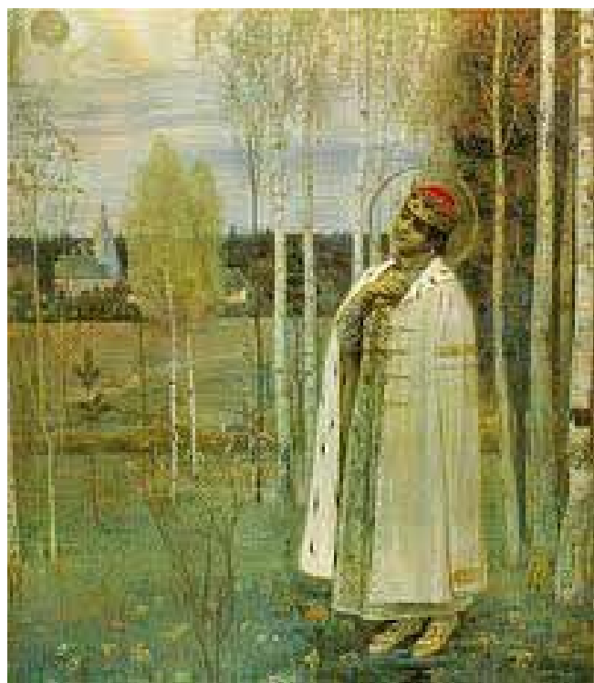
Картина от М.В. Нестеров

чеството - Йоан Кръстител, Йоан Евангелист и възвишената индивидуалност, възплътила се в Каспар Хаузер (1812-1833) напълно свидетелства за това, че в дадения случай е имал предвид истинския Димитрий, убит в Углич през 1591 г. А да се отговори на въпроса „откъде“ в духовно отношение е дошла тази индивидуалност, възплътила се на 29 октомври 1582 г. на земята в последния син на Иван Грозни, и главно „какво е трябвало да стане чрез нея“, е възможно само ако си представим ясно, каква би могла да бъде правилната, съответстваща на Духа на истинското Християнство и на бъдещите задачи на руския народ форма на проникване в Рус на импулсите на Разсъдъчната душа или Душата на чувството. Тази правилна форма не би трябвало да пречи на бъдещото развитие у източно славянските народи на Съзнателната душа и свързаното с нея формиране на свободната индивидуалност, а напротив, всячески да подготви нейното възникване. По-нататък би трябвало да бъде абсолютно свободна от всякакво демонично влияние и свързаните с него насилия и жестокости. И накрая, такава Разсъдъчна душа или Душа на чувството е трябвало да се проявява не в механичното заимстване на най-новите достижения на Запада, а в тяхното органично преработване в съответствие с живеещия в гъбините на източно славянската душа „Дух на Граала“. А това означава, че на Изток в Европа в онова време е трябвало да възникне Разсъдъчна душа или Душа на чувството, действително пронизана от Христовия Импулс.