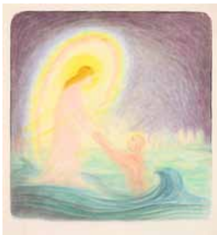
„Спасението на душата” Герхард Райш

на кръв. Тя постепенно е обхваната от имагинациите, пробудени от Видар и е осенена от мисловната светлина на Христовото съзнание в човека. Целият този процес се осъществява на фона на образа на архангел Михаил, отпечатан върху човешкото етерно тяло, който отстранява ариманическото въздействие на дракона от областта на сърцето, където се разиграва описаното събитие, и го изтласква в метабличната система и крайниците на човека.