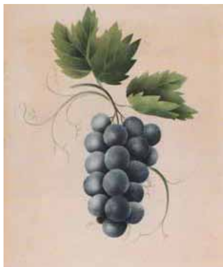
Акварели от Каспар Хаузер

повторило в живота и смъртта на Каспар Хаузер. Дори днес, 200 години след трагичния му живот, братствата на злото продължават да го дискредитират. Просто прочетете изказванията на Уикипедия за него. Там авторите пишат, че той е бил измамник, престъпник, предразположен към цинизъм и патологичен „лъжец“. Нищо не може да бъде по-далеко от истината, както тези твърдения. Уикипедия не казва нищо за красивата поезия, която е писал Каспар, за магичните му способности да общува с животните, за острите му сетивни усещания, за пълното му преклонение и почит към цялата природа, за неговото свято и опрощаващо отношение към мъчителите му. Те имаха също наглостта да твърдят, че той не е бил убит, а сам си е нанесъл фаталния удар с нож! След като прочетох най-малко 12 книги и статии за Каспар Хаузер, мога да свидетелствам, че така нареченото изследване в Уикипедия е изопачено от черните братства, неблагоприятните свидетели за онзи период. Има също големи пропуски в техните съмнителни ДНК изследвания. Едно от тях всъщност разкрива, че Каспар наистина може да е бил от благородническия Дом Баден.