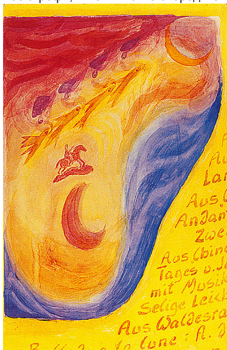
Лунният конник (Песента за съня на Олаф Остесон) - акварел от Р. Щайнер

Д-р Щайнер сподели с мен, че има намерение след време да публикува тези факти, както и други важни неща свързани с песента. Той обаче не искаше да направи това,