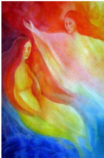
Музата на евритмията

Адвентът е времето на тишината, на тишината на пастирите, на тишината на кралете. И на тишината на човека. Всяка тишина е свята, просто трябва да слушаме паузите... И трите крачки навътре – та къде другаде биха ни отвели, освен към собственото ни Рождество?