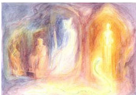
Четиримата царе и змията

Ако човек не разбира какво е искал да каже Гюте, той може да се разочарова от отговора на змията, който едва ли отговаря на очакванията му да чуе някакво откровение. Защото дали разговорът – такъв, какъвто го познаваме в ХХ