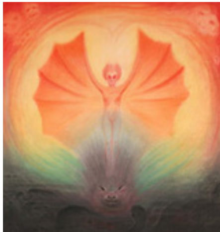
Малкият пазач - Г. Райш

Когато се научим да разглеждаме човешкия живот и човешкото същество от космическа гледна точка, бихме могли по-добре да разберем следните думи на Рудолф Щайнер: „Сега ние можем да получим представа за това, което се случва с човека, когато възниква нещо болезнено. Съзнанието, което той има между раждането и смъртта, го води до това, че той е повален от своята болка. Ако си спомни какви намерения е изработил между смъртта и новото раждане, той би почувствал онази сила, която го е довела на мястото, където е могъл да изпита тази болка, защото той е почувствал, че може само благодарение на преживяването на тази болка да достигне отново онази степен на съвършенство, която лекомислено е погубил и е длъжен отново да достигне. Тогава обикновеното съзнание му говори: "Болката е тук и ти страдаш от нея! Но за съзнанието, което обхваща и времето между смъртта и новото раждане, целта е именно търсенето на болката и някакво нещастие." (Събр. съч. 166 „Необходимост и свобода“)