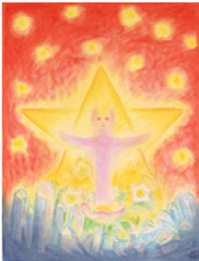
Дете от светлина - Герхард Райш

Усещам сякаш от магия освободен младенецът на духа в душевната утроба. В светлината на сърцето святото мирово слово роди небесния плод на надеждата, който израства ликуващ в мировата шир от корените на моята божествена същност.