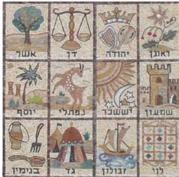
Схематично изображение на дванадесетте племена на Израил - мозайка

Градът имаше голяма и висока стена, с дванадесет порти, и на портите дванадесет ангела, и надписани над портите имена, които са имената на дванадесе-