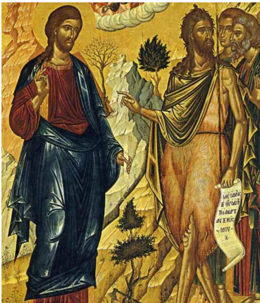
Иисус Христос и св. Йоан Кръстител. Икона от XVII в.

И Ето, Аз изпращам пред лицето Ти Моя Ангел, който ще приготви Твоя път пред Тебе. Гласът на викация в пустинята говори: пригответе пътя на Господа, прави правете пътеките Му