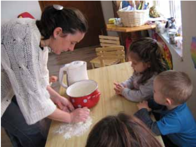
Всеки ден в Слънчогледи носи за децата нови емоции

Всеки ден в ателие „Слънчогледи“ започва с приемане, посрещане на децата и свободна игра, докато дойдат всички. Следва дневното занятие, определено според деня от седмицата. След това измиваме ръцете, правим ритмичен кръг, закусваме с чай, сок и плодове и се подготвяме за разходка. Навън сме до 12.15, прибираме се и отново измиваме ръцете, този път е съчетано с игри с пръсти, за да е по-лесно изчакването. Четем приказка, която е една за цялата седмица, обядваме и се подготвяме за сън. Следва следобедна закуска, свободна игра, четене на приказки и други леки занимания до идване на родителите. Никога не е едно и също, стремим се да спазваме основния ритъм на деня и седмицата, но нещата конкретно се случват според състоянието на децата.