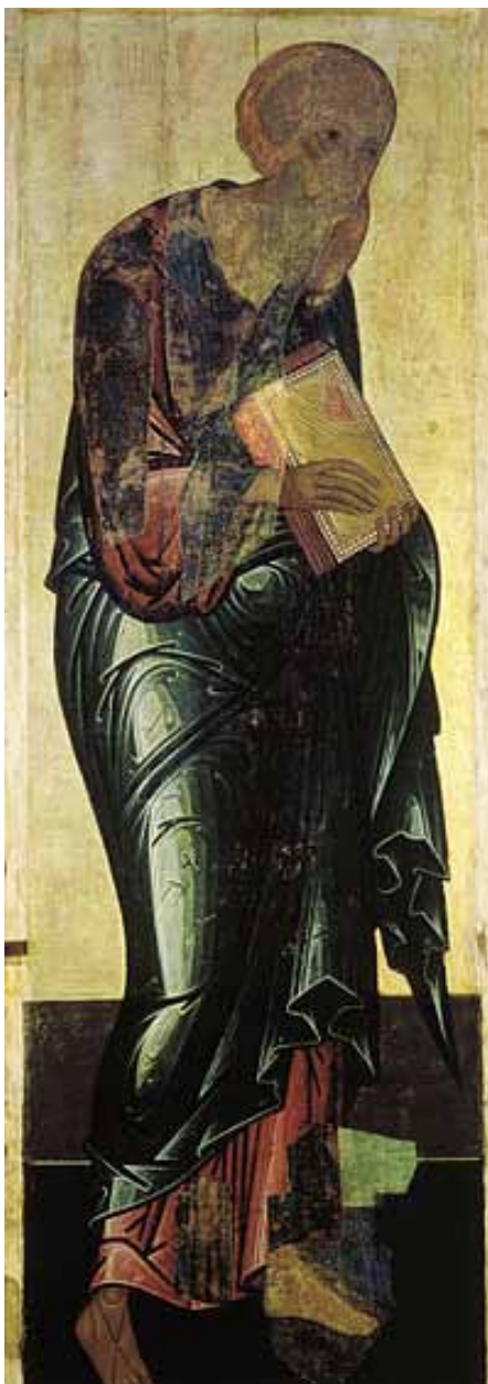
Йоан Богослов - икона от Андрей Рубльов

„След това видях голямо множество, което никога не можеше да изброи, от всеки народ, и от всичките племена, люде и езици, стоящи пред престола и пред Агнето, облечени в бели дрехи, с палмови клони в ръцете си. И рекох му: Господине мой, ти знаеш. А той ми каза: Това са ония, които идат от голямата скръб; и са опрала дрехите си, и са ги избелили в кръвта на Агнето.“(гл.7/9,14)