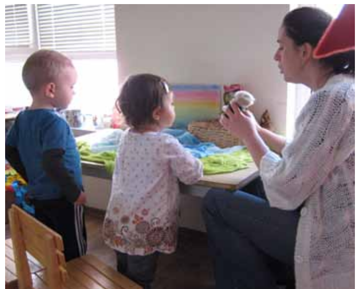
Разходка в света на приказките