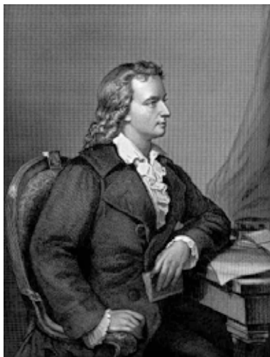
Фридрих Шилер 1759-1805