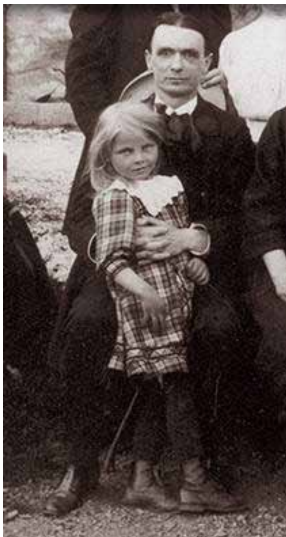
Рудолф Щайнер, Цюрих 1918 г.

Пред сериозното лице на настоящето заставаме със свещените дела на Духовната наука и вярата, че слънцето на тази Духовна наука ще расте, ще става все по-ярко. Това е слънцето на мира, любовта и хармонията между хората