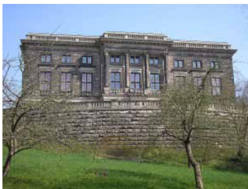
Най-старият литературен архив в Германия – на Гьоте и Шилер във Ваймар

По този повод в същата лекция Рудолф Щайнер пише: „Този разговор представлява едно симптоматично и многозначително оповестяване на новата Духовна наука, антропософията. Какво всъщност проговори тогава у Гьоте, когато той възрази на Шилер? У Гьоте проговори съзнанието, че външният обективен свят, външните истини могат да бъдат