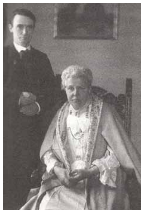
Рудолф Щайнер и Ани Безант 1917 г.

Отново и отново трябва да сме наясно пред душата си за това, как ни предизвиква нашето време. Ежечасно, ежеминутно ни предизвиква: Бъди буден! Но духовната наука, антропософски ориентираната духовна наука ще бъде разбрана днес само от този, който е в състояние да схване, че човечеството е изправено пред или-или: или духът ще бъде разбран, или хаосът ще остане. Един маскиран хаос не би бил по-добър от днешния кървав хаос.