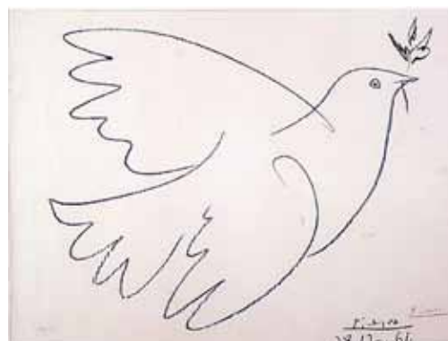
Гълъбът на мира – Пабло Пикасо