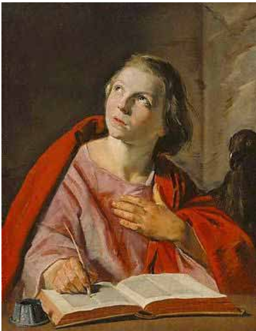
Евангелистът Йоан – Франс Халс (1625 г.)

„Този е ученикът, който свидетелства за тия неща и който ги написа и знаем, че свидетелството му е истинно.“ (Йоан, гл. 21, 24)