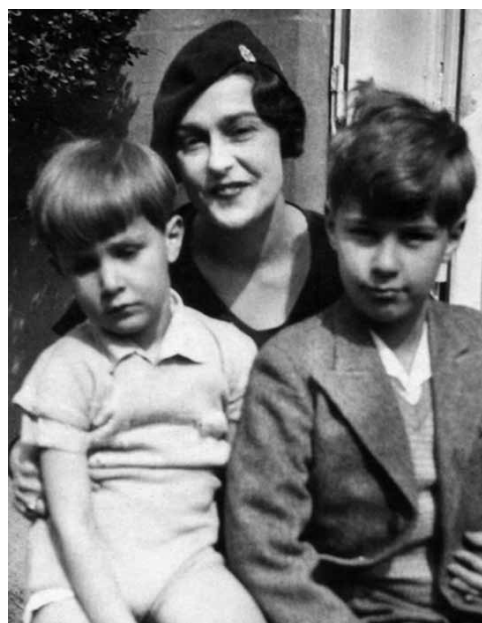
Каролина Кодина – Прокофиева със синовете си