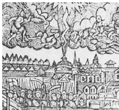
Визуална времева линия на римско-еврейската война

Именно в еврейската тайна доктрина това сливане в овладяването на земното и в усвояването на земните съставки за човешкото развитие се разглежда по много специфичен начин. Вижте, що се отнася до физическото може да се признае, че земята е подредена по такъв начин, че да има северен полюс, където, тъй да се каже, се събира студът; и този северен полюс може да се опише физически и географски и да се разглежда като нещо съществено за земята. Еврейската тайна доктрина направи това и с духовната дейност, скрита в силите на Земята, и видя - като в смисъл на географски северен полюс - полюса на земята, където се влива всяка култура, където, следователно, са събрани най-съвършените къщи, и тя видя това в Йерусалим, в съвсем конкретния град Йерусалим. Това беше полюсът за съсредоточаване на външната култура около човешката душа, а венецът на този град беше Соломоновият храм.