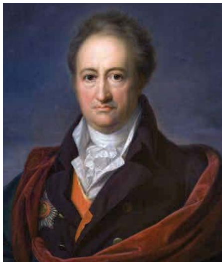
Портрет на Гьоте , 1808/09 г.

В края на Първата световна война Щайнер изнася лекции, в които говори за необходимостта да се направи следното основно диференциране: първо, във връзка с принципа на смъртта в света и второ, във връзка с принципа на злото. И за двете той посочва интересно сравнение: когато един локомотив се движи по релси, очевидно е, че с времето това ще изтърка релсите. Но ще бъде съвсем погрешно да се каже, че целта на локомотива е да изтърка релсите, макар че тъкмо това се случва. То обаче е само „страничен резултат“ от действителната задача на локомотива. По същия начин трябва да