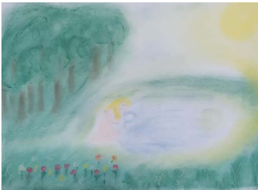
Илюстрация от приказката „Железният Ханс“ на братя Грим – Дора Петрова

Красотата сияйна на света ме кара от душевни дълбини Божествените сили на живота мой за полет във всемира да разгърна; себе си да изоставя и с доверие да се открия в мировата светлина и топлина.