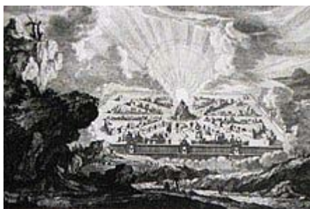
Ново небе и нова земя [Откр.21:1], Библията на Мортие

Виждате ли, това започва от мистерията на Голгота, този растеж на новия Йерусалим. Когато земното му време е вече изпълнено, човекът ще е стигнал дотам, че не само ще вкарва небесната субстанция в собственото си тяло чрез сетивата си, но и ще разширява тази небесна субстанция чрез духовно знание и изкуство до това, което ще бъде външният град, до продължението на тялото в смисъла, в който го обясних. Старият Йерусалим е построен отдолу нагоре, новият Йерусалим наистина ще бъде построен отгоре надолу. Това е огромната перспектива, която произхожда от една визия, от свръх колосалната визия на автора. Пред него се издига това могъщо нещо: всичко, което хората са могли да построят, се издига от земята и това беше концентрирано в стария Йерусалим. Това вече приключи. Той видя това издигане и загиване в стария Йерусалим и видя човешкия град на новия Ерусалим да слиза отгоре, от духовните светове.