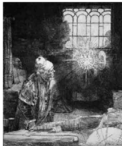
„Фауст“ – Рембрандт, около 1652 г.

С други думи: злото, на което в Пролога е дадена, тъй да се каже, зелена светлина, сега роптае в душата на Фауст. Това е второто ниво. Наричам го психично ниво, защото го разяжда отвътре. Човек не може да го разбере, ако е забравил Пролога. Защото в него се показват космическите предпоставки за това отдаване на самосъжалението. Фауст вече е станал истинска жертва на Мефистофел, който рови в душата му.