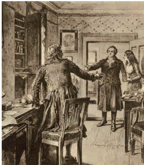
Дружбата между Гьоте и Шилер

В случая с така наречените престъпници, тази склонност става действие. Това е разликата между тях и обикновените хора. Гьоте е запознат с тази всеобхватна истина от вглеждането в собствената си душа. Затова той не претендира, че няма такива склонности. Ако отрича, с известна гордост, че не е склонен да завижда, това е напълно разбираемо. Разглеждайки живота на Гьоте разбираме, че той не е бил подложен на изпитания във връзка със завистта към другите – поради простата причина, че е един от малцината в съвременната епоха, който, тъй да се каже, до голяма степен се е справил с вътрешната си кармична програма, ако мога да използвам този грубоват израз. Той последователно става първи министър, драма-