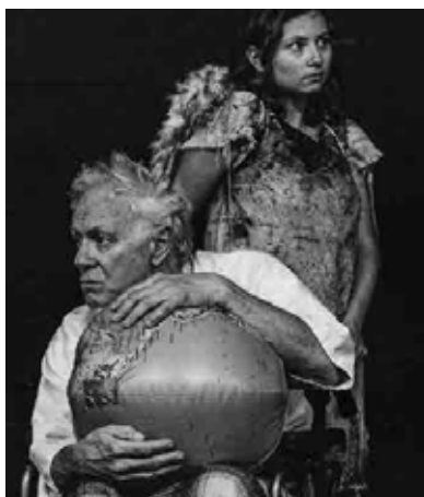
„Фауст“ – представление в Мутенц, Швейцария

През изтеклите седмици дори имаше представление на първата част на „Фауст“ в Мутенц, което си заслужава да се види както от положителната му страна, така и в симптоматичен критичен смисъл. Положителното е, че съкращението на текста е направено с много сериозно от-