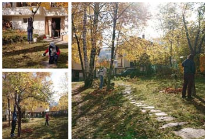
гост или домакин в подобни дейности.

На 14.11.2020 г. някои от участниците от състоялата се среща в Софера, както и нови гости, студенти агрономи и евритмисти се събрахме в една прекрасна градина в Драгалевци, където заедно приготвихме дървесната паста по Мария Тун и положихме грижи за плодни дръвчета - стари череши, различни сортове ябълки и дюли. Времето около новолуние бе благосклонно за тази дейност и срещата премина с голям ентузиазъм и творческа енергия. Благодарим на домакините за възможността заедно да разширяваме познанията си, свързани с практикуването на биодинамиката. Надяваме се този вид срещи да може да се поддържа на ротационен принцип и всеки заинтересован да се включи като