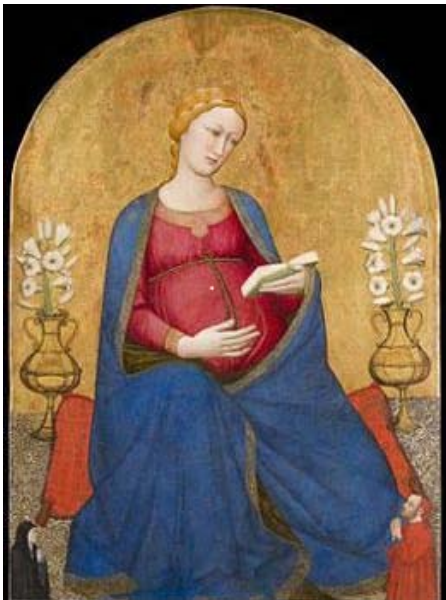
Мадона дел Парто, Пиеве ди Сан Лоренцо в Монтефиозоле

Едно от малкото изображения на Мария в състояние на бременност преди раждането на детето Исус. Тя е седнала на червена възглавница с лице, обърнато към книгата, която е вдигнала с лявата си ръка, за да я прочете. Това е моментът след посещението на Архангел Гавраил, за което свидетелстват лилиите, които я заобикалят. Косата и е сплетена като корона, а главата е заобиколена от златен ореол. Дясната ръка е поставена на корема, върху все още нероденото дете. Сякаш словото, изписано на книгата преминава в кръг от лявата ръка през сърцето и ума и, за да достигне чрез дясната ръка до детето в утробата и. В долната част на картината се забелязват две малки фигури в молитва. Те са в йерархични пропорции, съвсем умалени, спрямо изображението на Божията майка.