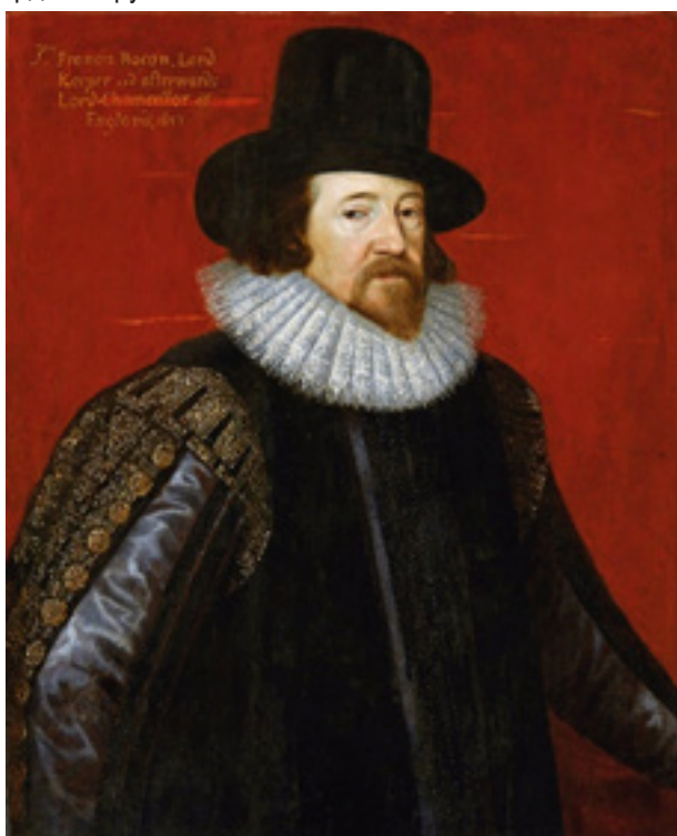
Лорд Френсис Бейкън (1561-1626), Варшава

да се каже, той е опоектизиращ учен или – както се казва тук – „обгръща това в поетична дреха, защото иначе не може да привлече вниманието към изобилието“ – докато това развитие е устремено натам, че по-късно, особено в нашето време, човек наистина ще достигне границата, неговите понятия ще бъдат съотнесени към фактите във външния свят, но от външния свят ще познава само повърхностното и всъщност вече няма да знае и да иска да знае никоя от тайните, които се крият зад или в недрата на природата. Всичко се събира по друг начин тук, в тези три личности, и всъщност точно Бейкън е този, който стига най-напред дотук и казва: „Всичко това, което би трябвало да се отнася до тези тайни и което е достигнало до нас от миналото, са идоли, няма нищо общо с действителността; трябва да насочим вниманието си към това, което можем да наблюдаваме, и това да обработваме с нашия интелект“. Така първоначално е охарактеризиран Джордано Бруно по важните аспекти.