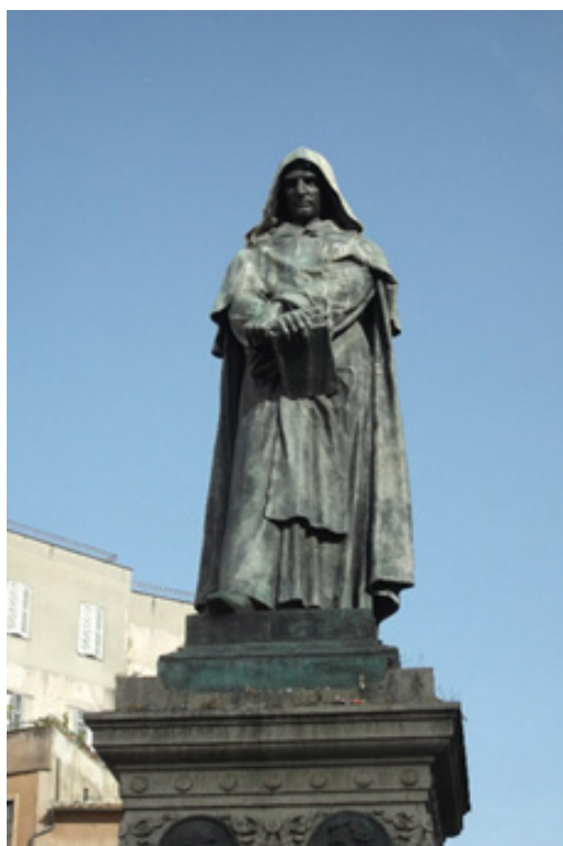
Джордано Бруно (1548-1600) статуя на Кампо дей Фиори, Рим

Всъщност породеното в самия Якоб Бьоуме в тази връзка, не е било онова, което той е бил в състояние да изрази в произведенията си по един прецизно формулиран начин. Това, което оживява в него при такива подтици, също не се появява ясно и точно в изказванията му, във формулировките му. И Вие всички ще потвърдите, че човек се чувства така, когато чете Якоб Бьоуме, че се чувства застигнат от интензивността на тази борба, но че среща големи трудности да се ориентира и че трябва да се съгласи, когато Рудолф Щайнер казва: „Всъщност това, което той вътрешно осъзнава и преживява, е изразено заекващо само от Якоб Бьоуме. „Човек може“, така казва Рудолф Щайнер, „да почувства как Якоб Бьоуме сякаш дъвче думите, докато се стреми да изкаже това“. Мисля, че до голяма степен може да се усети как той се бори да извлече нещо от тези думи, които всъщност вече не отдават това.